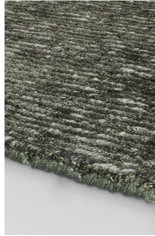
STL 08 Verde Fucile