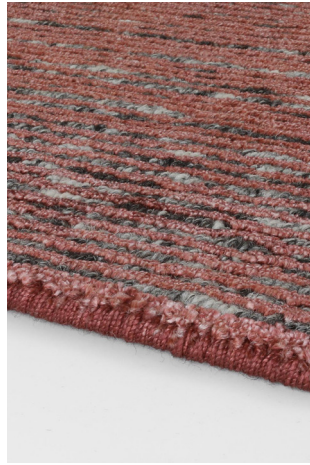
STL 07 Rosso Rubino