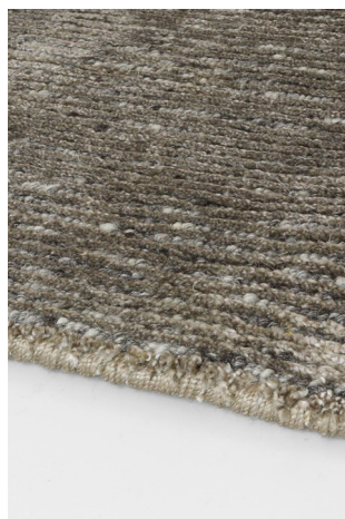
STL 02 Ottone Lucido