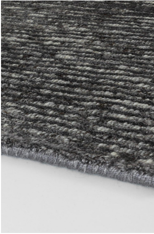
STL 06 Grigio Carbone