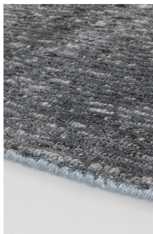
STL 04 Argento Cielo