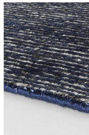
STL 05 Blue Imperiale

I dati forniti in questa scheda tecnica sono aggiornati al momento della pubblicazione. Carpet Edition si riserva il diritto di modificare materiali, dimensioni e caratteristiche senza preavviso. The data provided in these technical specifications are up to date at the time of publication. Carpet Edition reserves the right to modify materials, sizes and characteristics without notice.